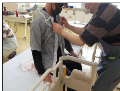
初任者研修実習： 生活支援技術実技（整容）