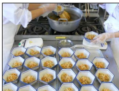
大量調理実習（盛付）