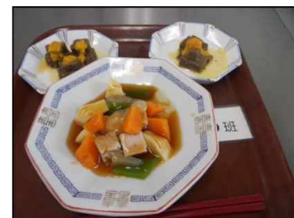
嚥下困難者向けの食事 （ソフト食の酢豚）