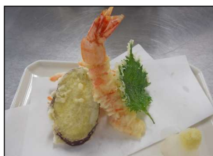
基礎調理 （和え物、揚げ物、焼物など）