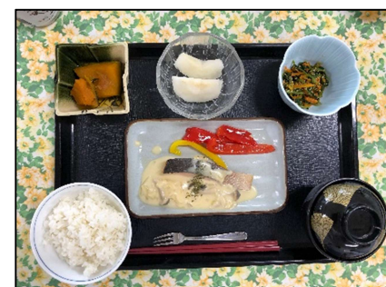
大量調理実習（常食、定食形式）