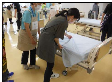
初任者研修実習： 介護技術の基本（ベッドメイキング）