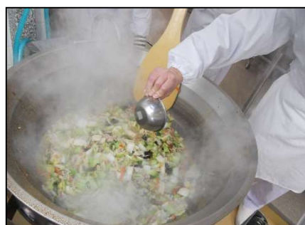
大量調理実習（大量調理機器）